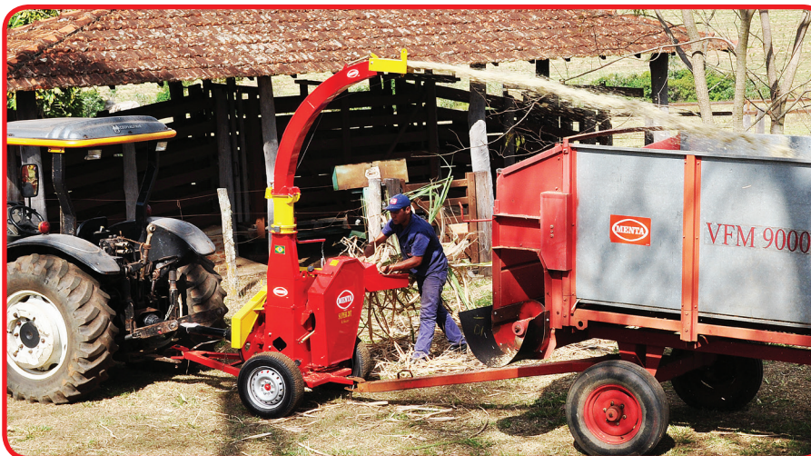
• CTT - Carreta tração tractor.