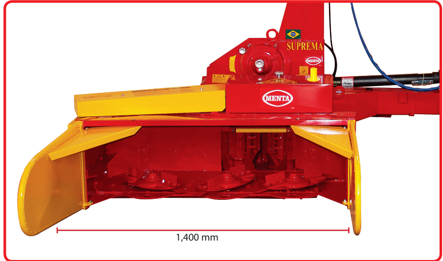
PMCD 1.3 - Plataforma recolhadora de capim e gramíneas plantados em área total, com 3 discos de corte. Plataforma cosechadora de pasto y gramíneas en área total, con 3 (tres) discos de corte.